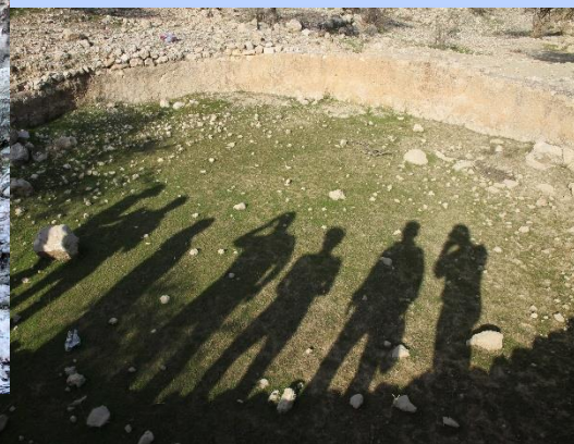
آب انبار دو توولی

شهرستان حم در استان بوشهر به لحاظ برخورداری از سازه‌های آبی کهن، بی‌تردید از بی‌همتاترین پهنه‌های باستانی کشور به‌شمار می‌آید. این پهنه‌ها در برگیری چندین سد بلند باستانی و ده‌ها بند کوتاه، صدها آسیاب، آب‌انبار و قنات، بگی با دیرینگی کهن، به‌خودی‌خود یک نمایشگاه بزرگ سازه‌های آبی عهد باستان است. بیشترین سازه‌ها، همراه با دیگر سازه‌های آبی، یک سیستم هیدرولیکی و سگفت‌انگیز را تشکیل می‌دهد، چندانکه کارکرد هر کدام از این سیستم‌ها در جای خود دانش و بینش ژرف ایرانیان در بهره‌برداری از آب در ایران باستان را بازگو می‌نماید.