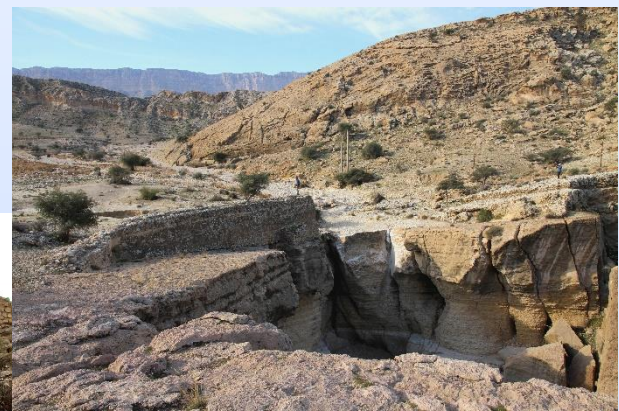
سد دو توولی