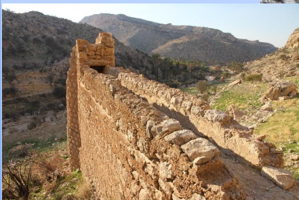
آسیاب میر معما