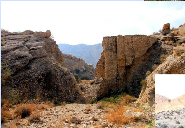
سد چه بند