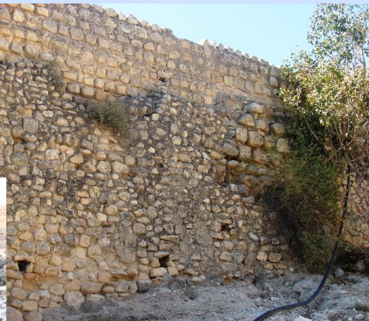
سد گلو کلات