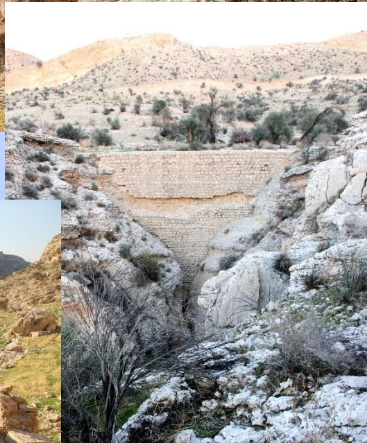
سد میر معما (ارتفاع ۱۶ متر)